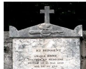
Sa tombe au cimetière de Voreppe

A son enterrement, « il fallut porter à travers les rues du village le cercueil ouvert pour permettre aux habitants, qui se pressaient sur le trajet, de contempler une dernière fois le visage du bon docteur ».